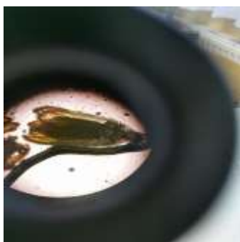
Zasnova cveta pod mikroskopom