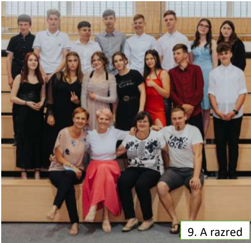
9. A razred