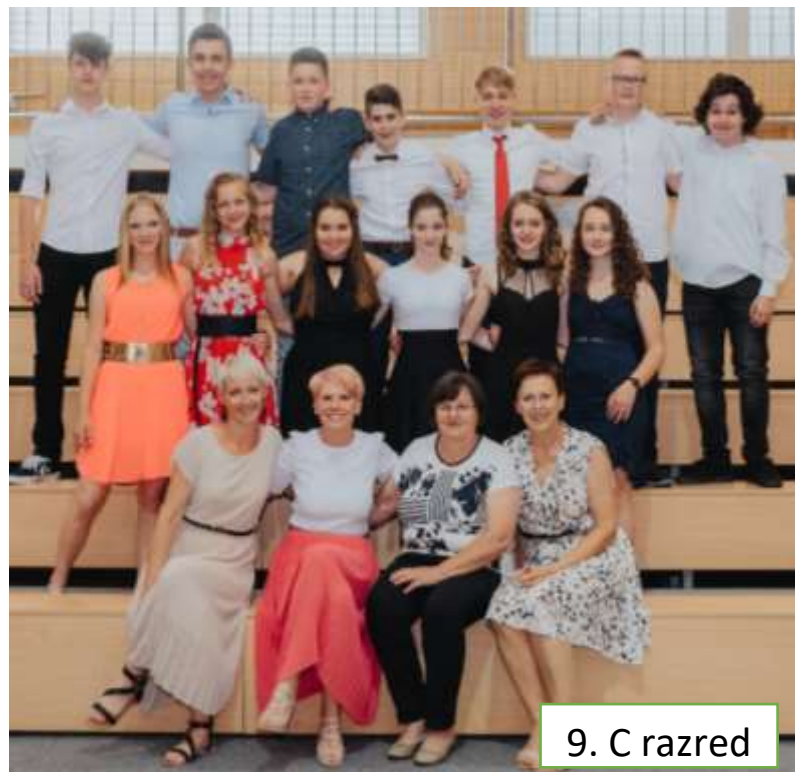
9. C razred

Skozi leta smo postali dobri prijatelji ter radovedni raziskovalci šolskih klopi in okolice. Preživeli smo veliko lepih, zabavnih in nepozabnih trenutkov, ki bodo spomin za celo življenje. Sedaj bo na šoli 48 problemov manj. Spremljali ste nas na poti do znanja, nas učili vse mogoče za življenje, včasih pa tudi nič pametnega. Za vso poklonjeno modrost HVALA! Zdaj lahko povemo tudi to, kar ste že tako vsi vedeli. NAJBLJUBŠI DEL POUKA SO BILI REKREATIVNI ODMORI! Čeprav se naše osnovnošolske poti končujejo, nas vodijo v različne kraje, ostajamo prijatelji. Hvala vam za devet najlepših let, ki jih ne bomo nikoli pozabili!