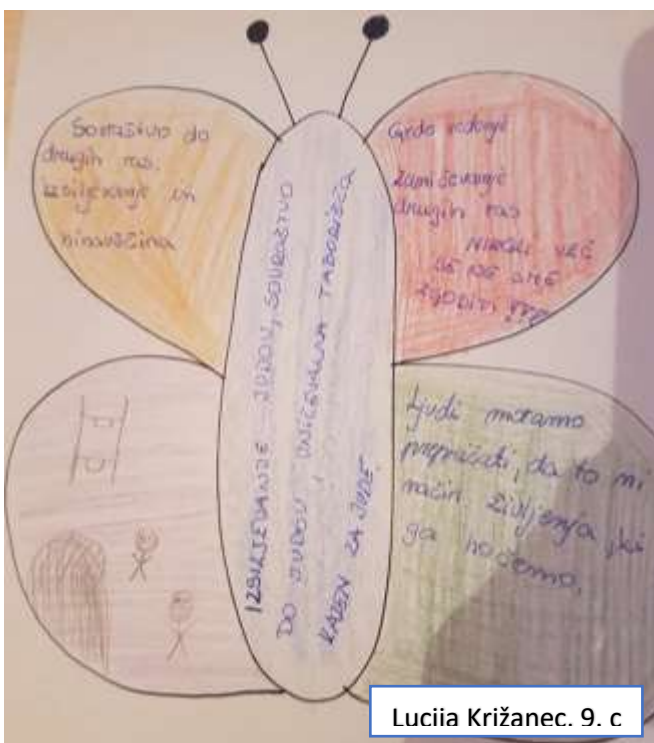
Lucija Križanec, 9. c