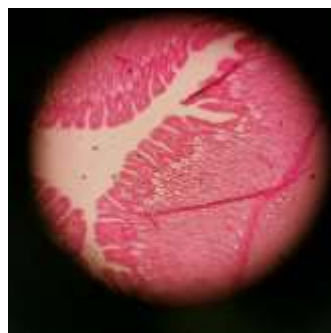
Želodčna sluznica pod mikroskopom