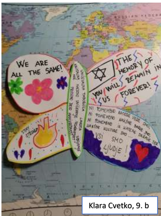
Klara Cvetko, 9. b