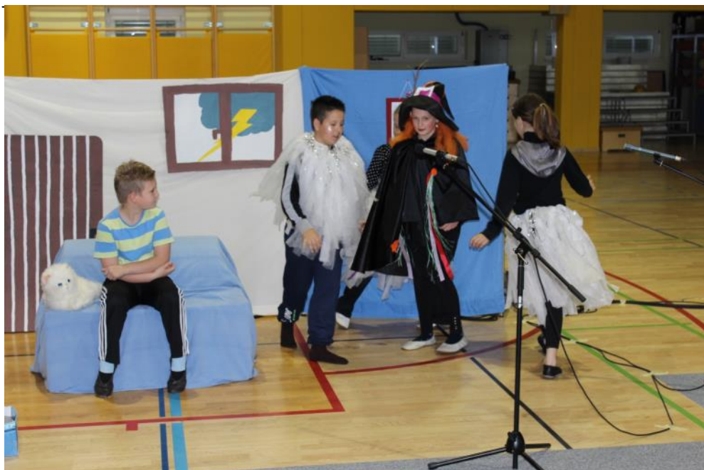
Četrtošolci med igro