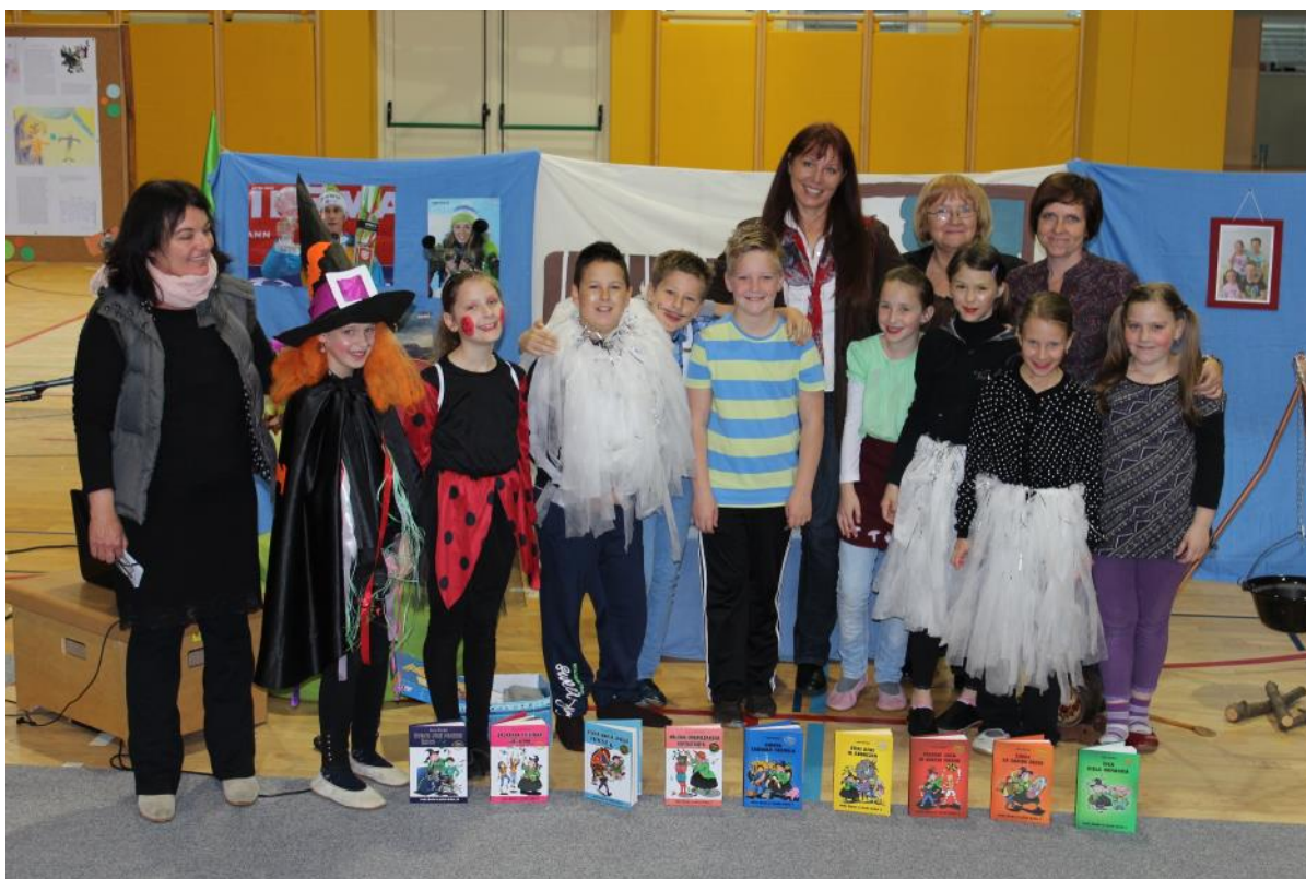
Igralska zasedba z gostjami

O igralskem poklicu zaenkrat še ne razmišljamo, je pa nas kar nekaj, ki nas tovrstno delo veseli.