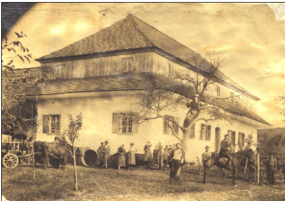
Slika 4: Wibmerjev "štok" v Hrastovcu iz spominske knjige družine Wibmer.