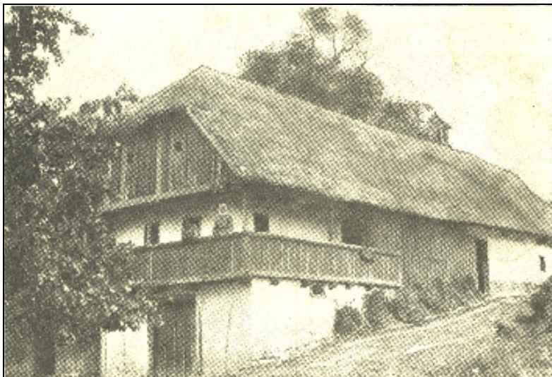
Slika 3: Viničarija v Goričaku okoli 1935.

kraj nekoč kar klical po pomoči. Krajše povzetke omenjenih opisov podajam v nadaljevanju moje raziskovalne naloge.