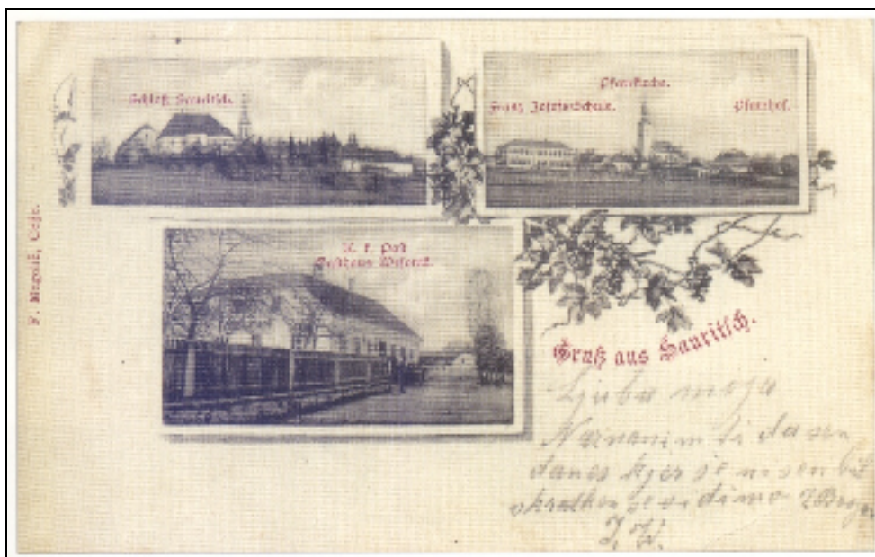
Slika 2: Razglednica z motivi iz obmejnega Zavrča, poslana 1902.

Po podatkih iz leksikona je bila šola ustanovljena 1812, imela je 5 oddelkov. Za mojo raziskavo je pomemben podatek, da so v završki šoli po podatkih iz Leksikona Dravske banovine, takrat delovali Podružnica Jadranske straže (PJS), Podružnica sadjarskega in vrtnarskega društva (PSVD), Gospodarsko izobraževalno društvo (Gospod. izobr. d.). 3