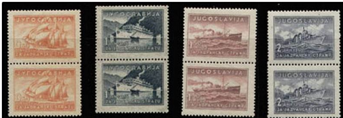
Slika 5: Primer priložnostnih znamk »ZA JADRANSKU STRAŽU«.

Pod nadzorom prosvetne oblasti – danes bi temu rekli šolska oblast, pa se je po šolah razširil Pomladek Jadranske straže, ki naj bi » mladino domoljubno in narodnoobrambno vzgajal ter krepil ljubezen do morja in narave. « 32