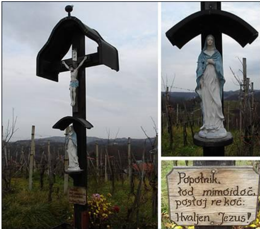
Goli križ v Slatini