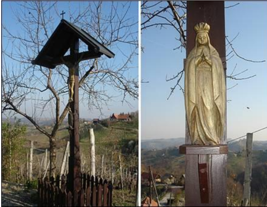
Dernikovičov križ