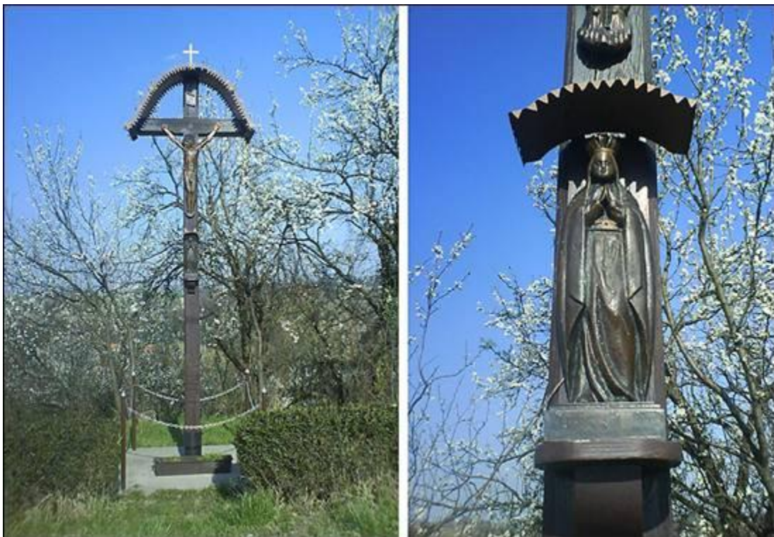
Anderjčekov križ v Slatini marca 2008.

Andrejčekov križ stoji v Slatini blizu hišne številke 28. Izvedeli sva, da je bil obnovljen, sicer pa poteka ob tem križu vsako leto tudi blagoslov velikonočnih jedi. Ob obnovi križa so bile nanj nameščene tudi nove podobe iz litega železa.