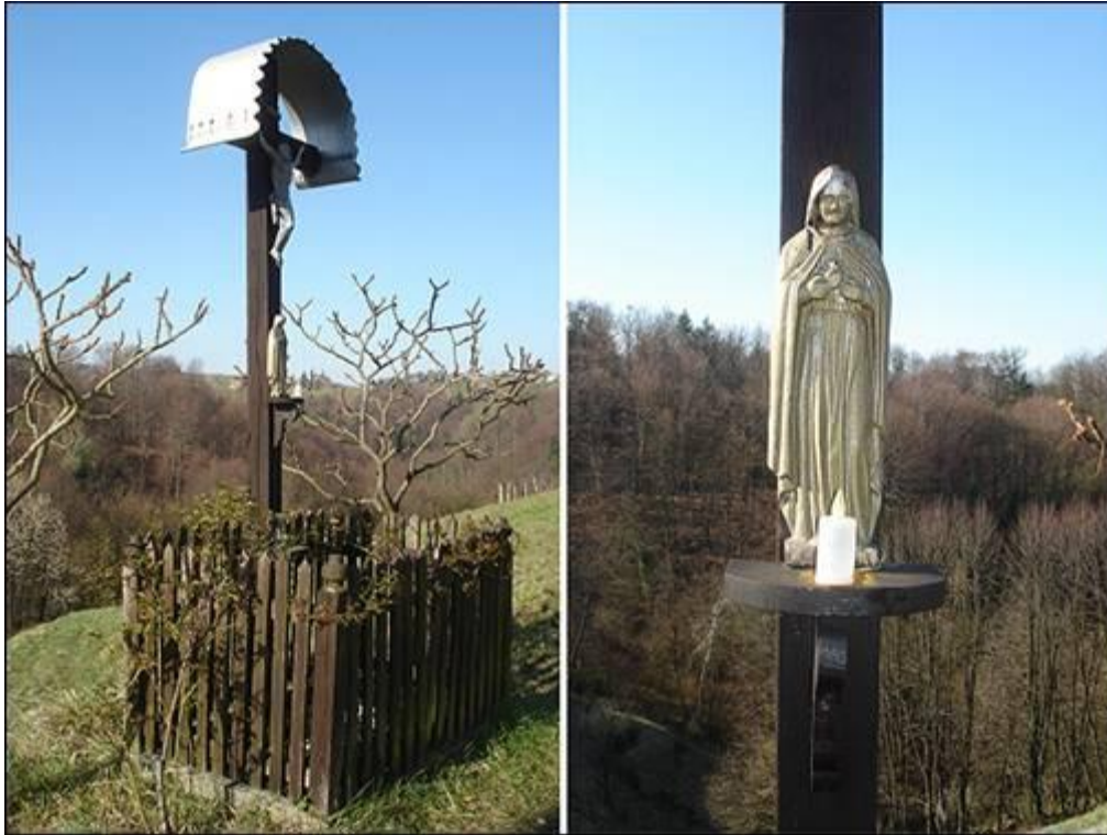
Švajgllov križ v Brezovcu