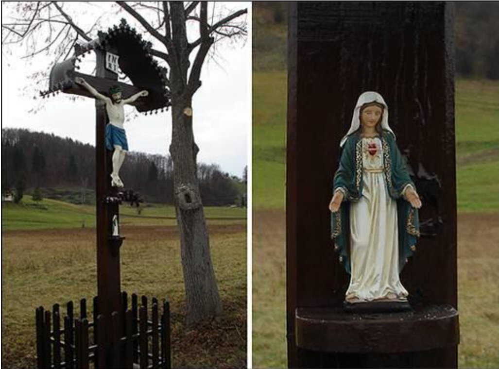
Hrastinski križ v Cirkulanah Fotografiral Ivo Zupanič novembra 2007.