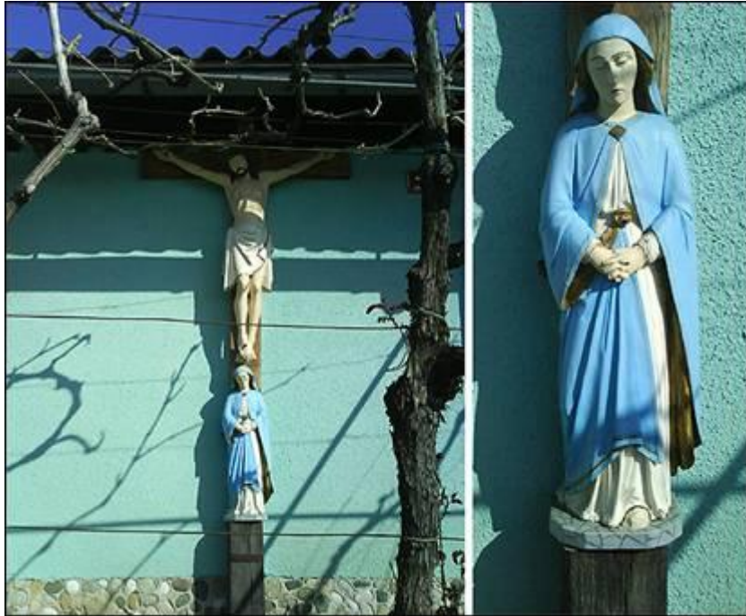
Grajski ali Kralov križ v Gradiščah marca 2008.

Dravi. Tako je ta utonil skupaj s kravjo vprego. V spomin na ta dogodek so nato postavili križ. Pozneje je Hanza Muhič, pdm. Kralov, dal križ prestaviti in obnoviti s pomočjo svoje družine.