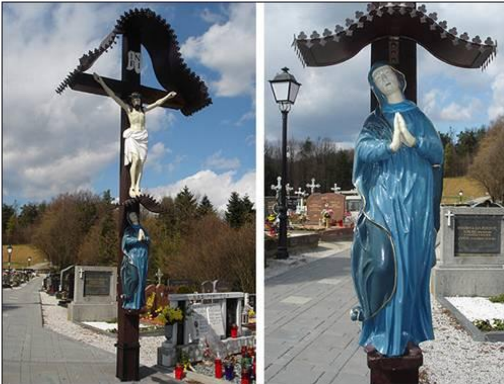
Križ na pokopališču v Cirkulanah Fotografirali Elvira in Mojca marca 2008.

rezljanima kipoma Jezusa in Marije. Za njega skrbi župnija Sv. Barbare, ki ga redno obnavlja vsakih nekaj let.