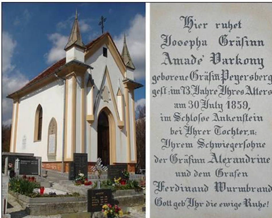
Kapela sv. Viljema na pokopališču v Cirkulanah Fotografirali Mojca in Elvira marca 2008.