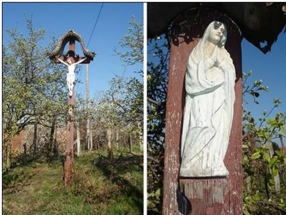
Hujčov ali Lovrov križ v Brezovcu Fotografiral Ivo Zupanič marca 2008.