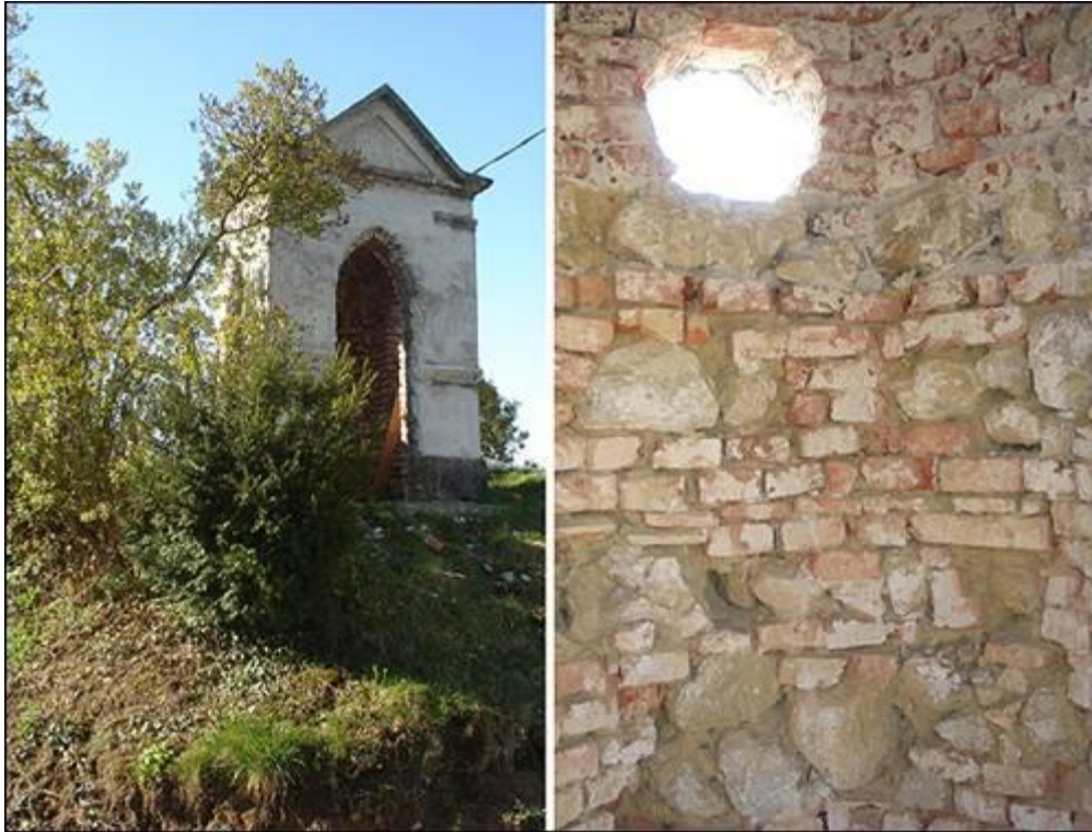
Barasova kapela v Brezovcu Fotografiral Ivo Zupanič marca 2008.

Trenutno je kapela, zidana iz kamna in opeke, v slabem stanju. Na nekaterih mestih se že ruši. Do sedaj ni nihče poskrbel za njeno vzdrževanje oziroma prenovo. Pričevalka nama je povedala, da se kapeli obetajo »boljši časi«, saj ima družina Dokl iz Kranja namen kapelo obnoviti. Pred porušitvijo jo je »rešil« sosed, ki je z grobim ometom stene vsaj nekoliko utrdil.