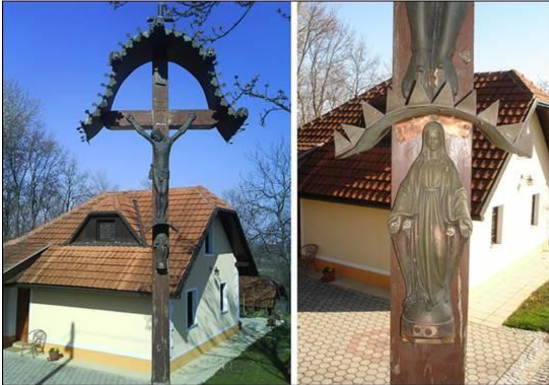
Juričov križ v Gradiščah marca 2008.