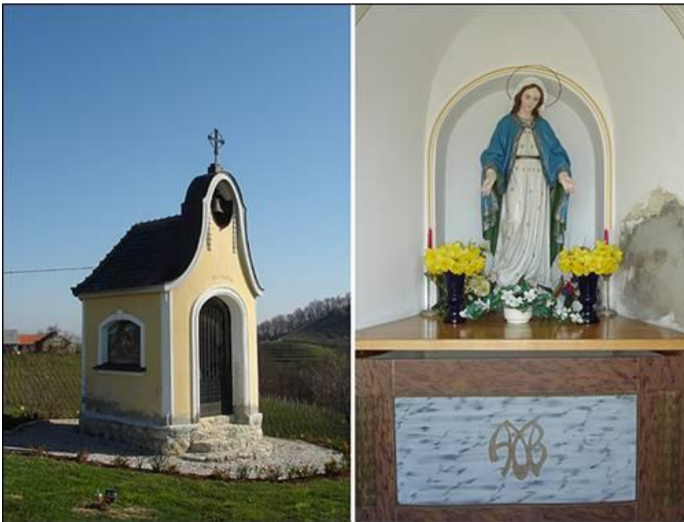
Štuhečova kapela v Gradiščah