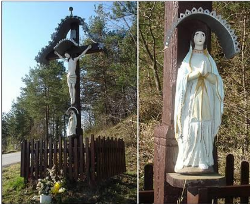
Gočlov križ v Brezovcu