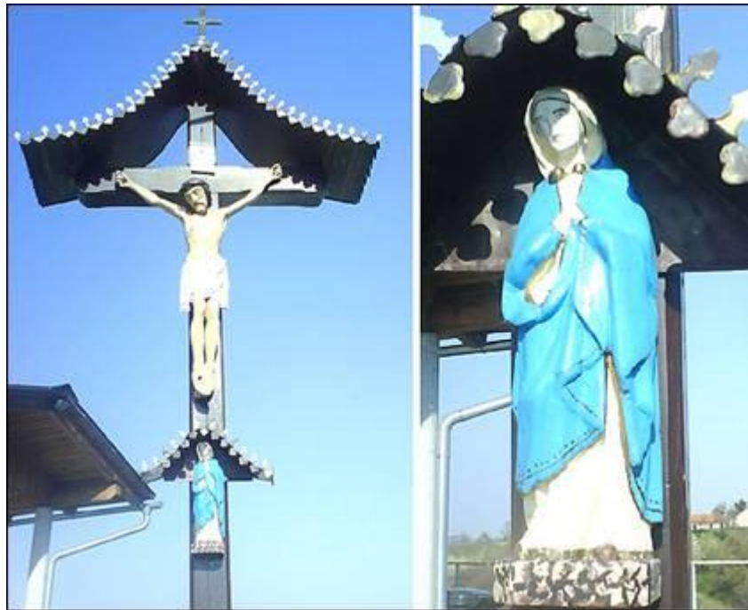
Tučinov križ v Slatini Fotografiral Darjan Arnečič marca 2008.

Tučinov križ se nahaja v Slatini pri hišni številki 33. Za zadnjo obnovo križa in obeh kipov je poskrbel sedanji gospodar Andrej Kokol.