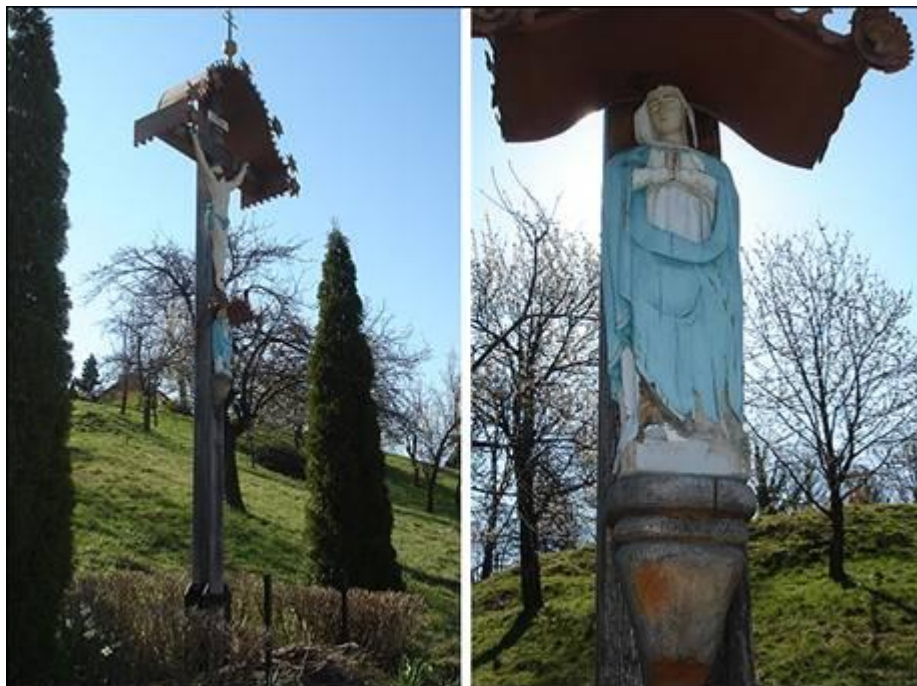
Oreški križ v Paradižu marca 2008.