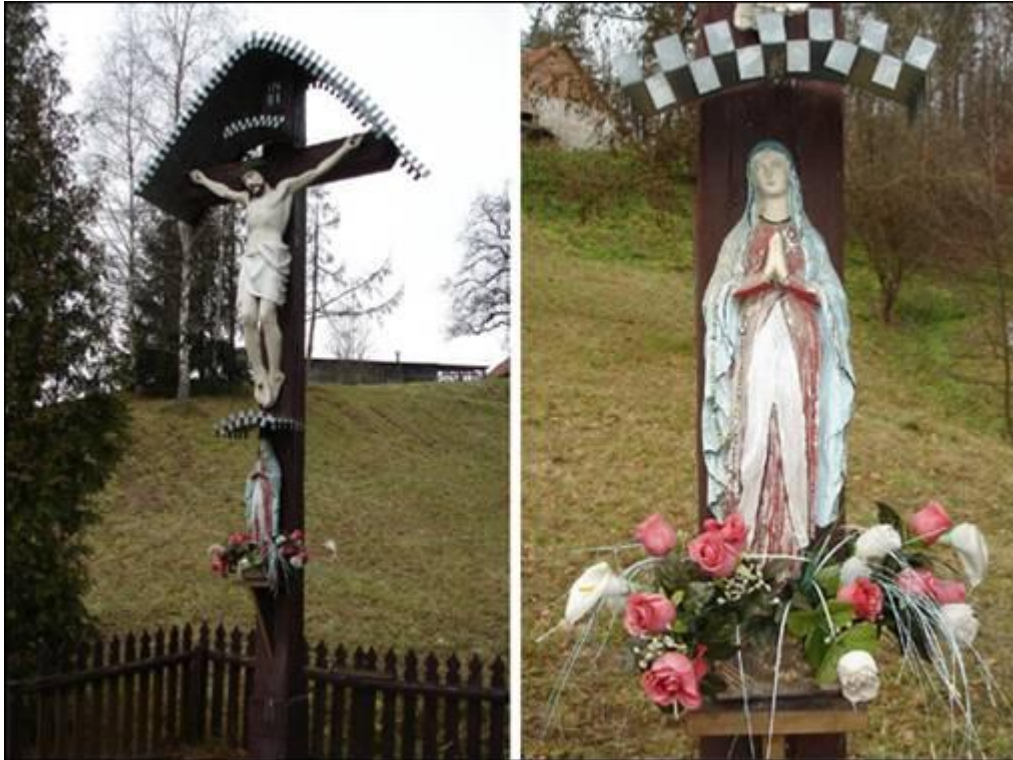
Petajov križ v Pristavi Fotografiral Ivo Zupanič novembra 2007.