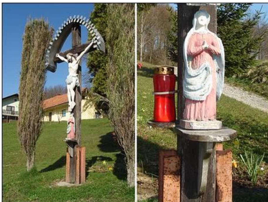
Dreisigarov križ v Pristavi Fotografiral Ivo Zupanič marca 2008.