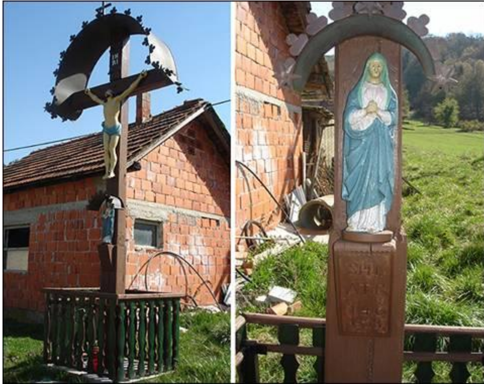
Križ na Kalapindži ali Kovačov križ Fotografiral Ivo Zupanič marca 2008.