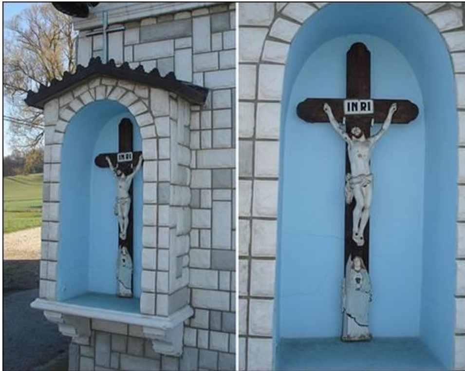
Zidna kapela pri Levičniku v Cirkulanah