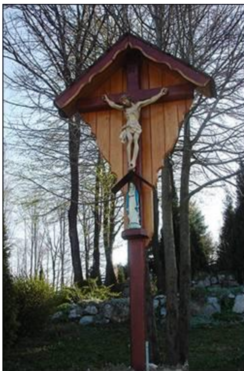
Gabrovčov križ v Paradižu Fotografiral Ivo Zupanič marca 2008.