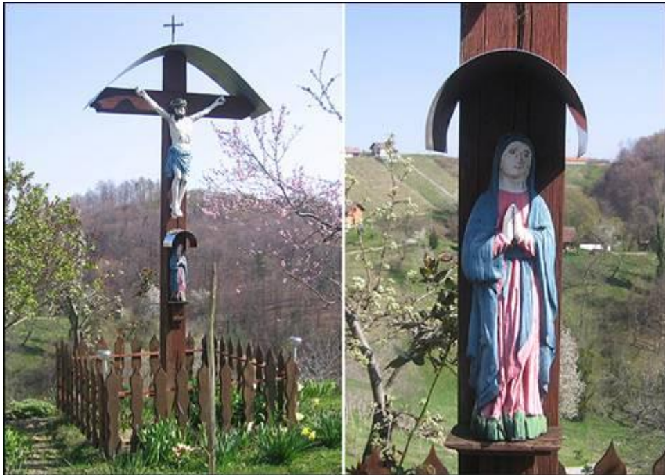
Ganzov križ v Brezovcu Fotografirala Mojca Preložnik marca 2008.

Izvedeli sva, da ga je leta 1947 dal postaviti njegov dedek, in sicer po vrnitvi iz ruskega ujetništva. V ruskem ujetništvu je obljubil svojemu sojetniku, da bo postavil križ, če se živ vrne domov. Povedal nama je tudi, da je bil križ prenovljen in prestavljen s prvotne lege. Včasih je stal križ na nasprotni strani ceste. Za obnovo in prestavitev je poskrbel gospod Marjan, tako obeležje rešil pred propadom in s tem tudi izkazal spoštovanje do svojega deda. Križ je opremljen s kipom Jezusa in Marije, pokrit s pločevinasto streho, obdaja pa ga lesena ograja. Obeležje je danes v dobrem stanju.