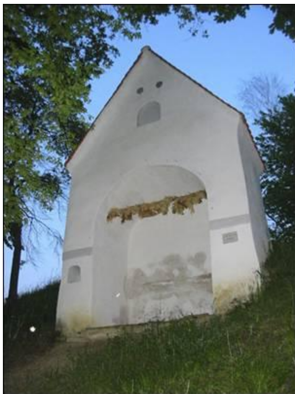
Kapelica križnega pota k sv. Ani na Velikem Vrh