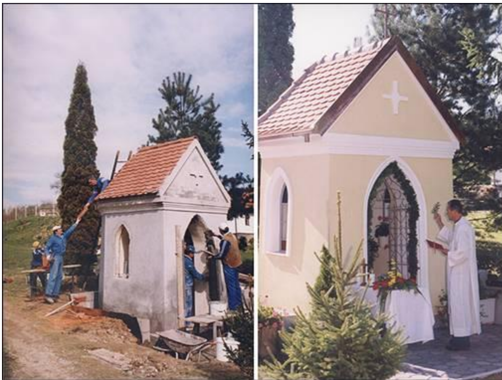
Habjanekova kapela v Dolanah