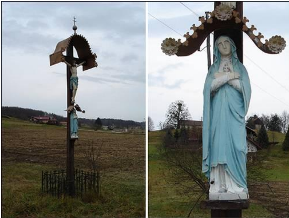
Gmajski križ v Pristavi Fotografiral Ivo Zupanič novembra 2007.