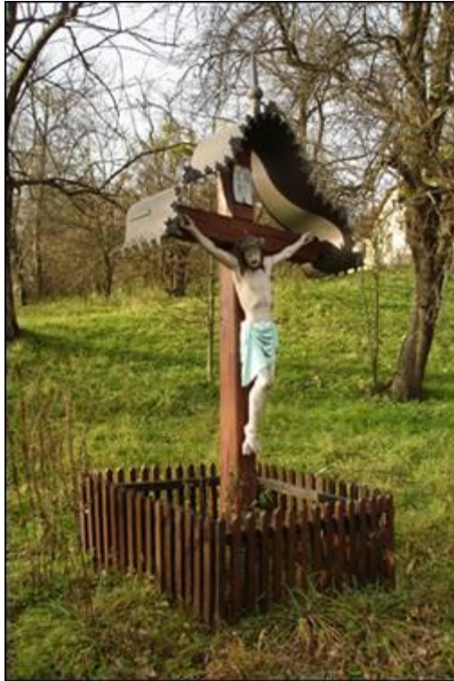
Klinčov križ v Dolanah Fotografiral Ivo Zupanič novembra 2007.

Gre za tipičen lesen križ z Jezusovim kipom, ki je iz lesa, popleskan z oljnimi barvami, trenutno dobro ohranjen. Križ ima tudi ograjo iz lesenih letev in je pokrit z značilno okrasno streho valovite oblike, narejeno iz bakrene pločevine. Kot sva še uspeli izvedeti, je bil v prvotnem stanju križ opremljen tudi s kipcem device Marije, ki pa je bil ukradena, zato ima danes obeležje samo kip Jezusa.