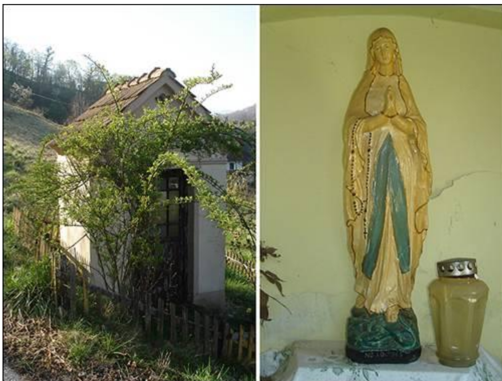
Mrkačova kapela v Paradižu Fotografiral Ivo Zupanič marca 2008.