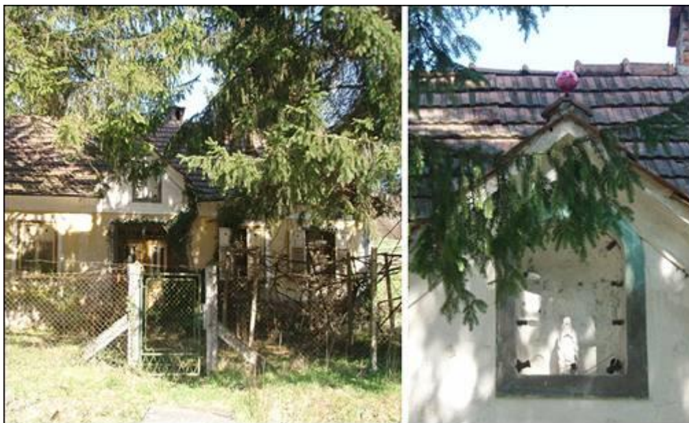
Zidna kapelica pri Korpički v Pristavi Fotografirala Ksenja Arbeiter marca 2008.