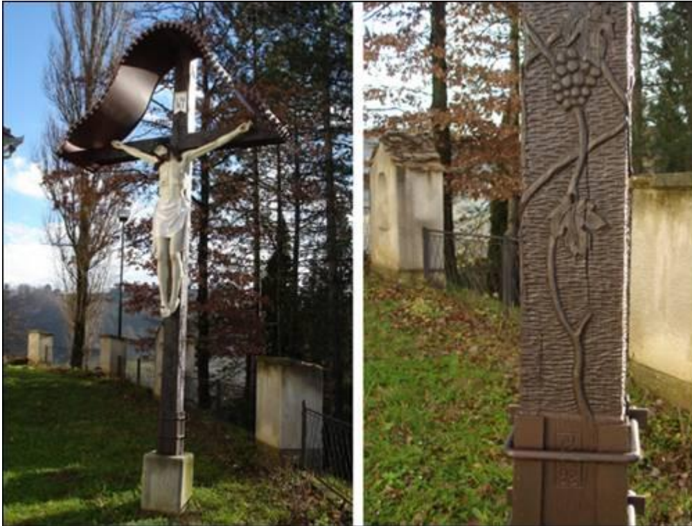
Križ pri farni cerkvi sv. Barbare v Cirkulanah Fotografiral Ivo Zupanič novembra 2007.