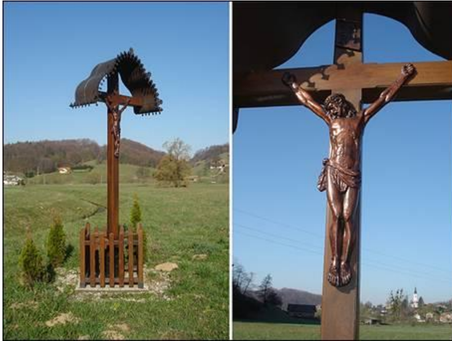
Bakušov križ v Cirkulanah Fotografiral Ivo Zupanič marca 2008.