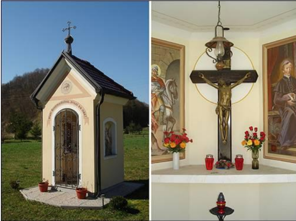
Toličeva kapela v Medribniku Fotografiral Ivo Zupanič marca 2008.

Toličeva kapela je posvečena Mariji Brezmadežni. Obeležje stoji ob potoku, v bližini križpota Paradiž-Medribnik, najbližja hišna številka obeležju pa je Medribnik 2.