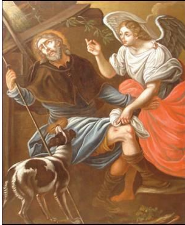
Slika sv. Roka hranijo v župnišču sv. Barbare Fotografirali Mojca in Elvira marca 2008.