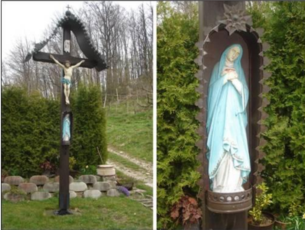
Kovačov križ v Gradiščah Fotografirali Mojca in Elvira marca 2008.