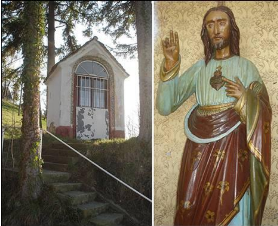
Škečova kapela v Gruškovcu Fotografiral Ivo Zupanič marca 2008.

Kapela leži na vzpetini ob cesti med smrekami. Do nje vodijo betonske stopnice. Kapela je opremljena s kipom srca Jezusovega, stene v notranjosti so popleskane in okrašene z rožnim vzorcem »valcnom«.