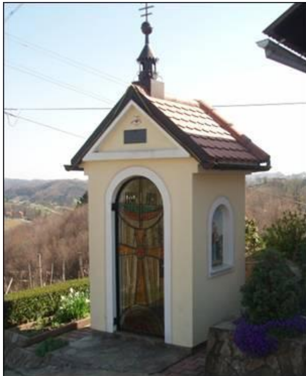
Guslova kapela v Malem Okiču Fotografirala Ksenja Arbeiter marca 2008.

Gre za novejšo gradnjo v bližini hiše Avgusta Milošiča v Malem Okiču št. 18. Kolikor se spomni g. Benjamin, je bila postavljena 2002, vendar ne ve zagotovo.