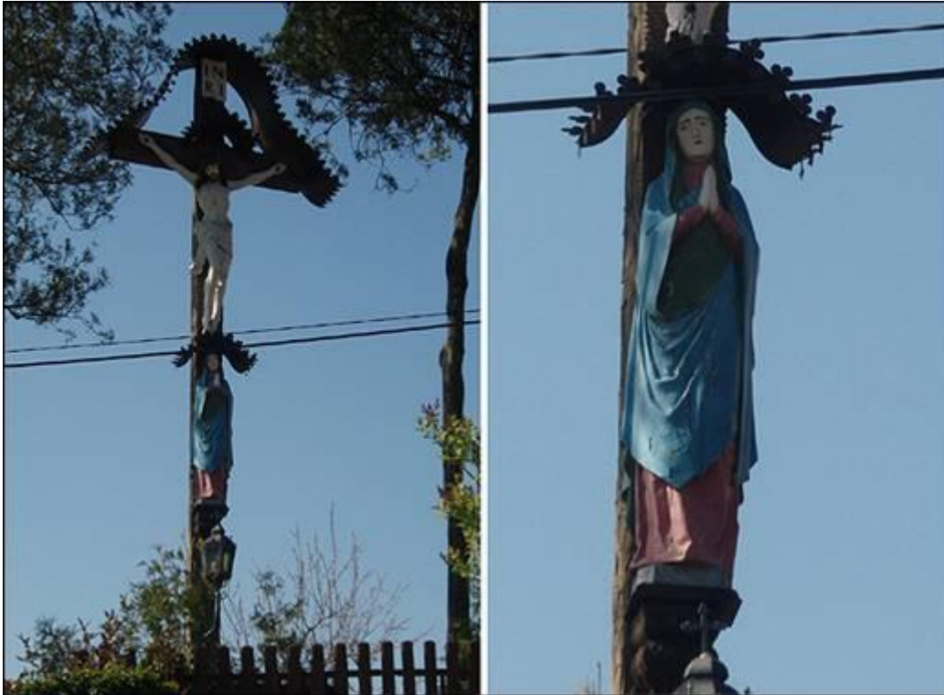
Ružni križ v Malem Okiču Fotografirala Ksenja Arbeiter marca 2008.