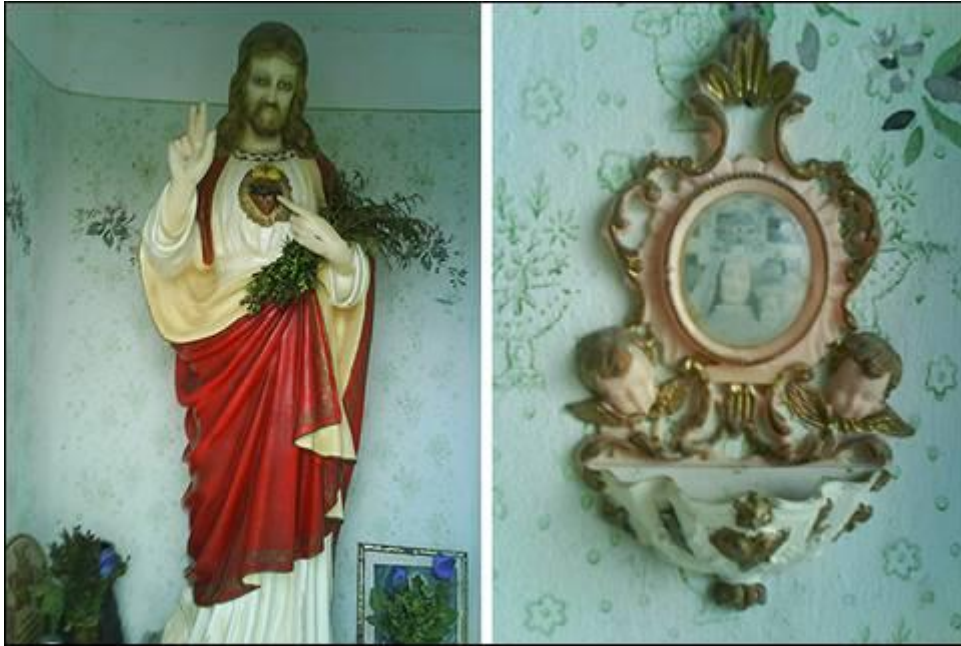
Hišna kapele pri Štefiki v Gradiščah Fotografirala Elvira Jurgec marca 2008.

Verjetno se je zaradi takratnih družbeno-političnih razmer odločil za postavitev obeležja v notranjih prostorih svoje stanovanjske hiše.