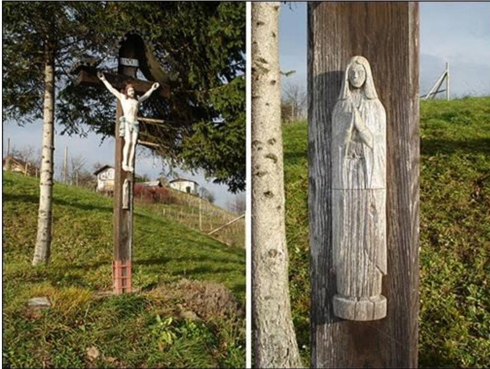
Lipasov križ v Gradiščah Fotografiral Ivo Zupanič novembra 2007.