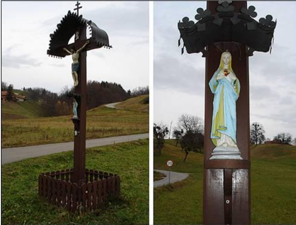
Župski križ v Pristavi Fotografiral Ivo Zupanič novembra 2007.